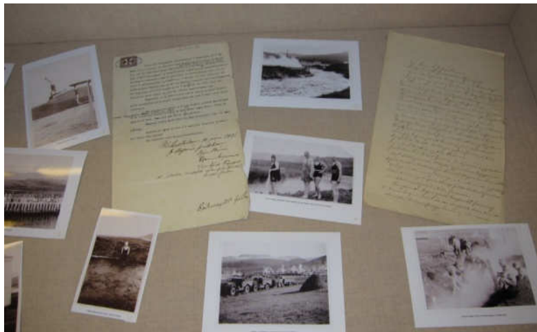
Úr sýningunni „Notkun á Varmá á fyrrihluta 20. aldar“