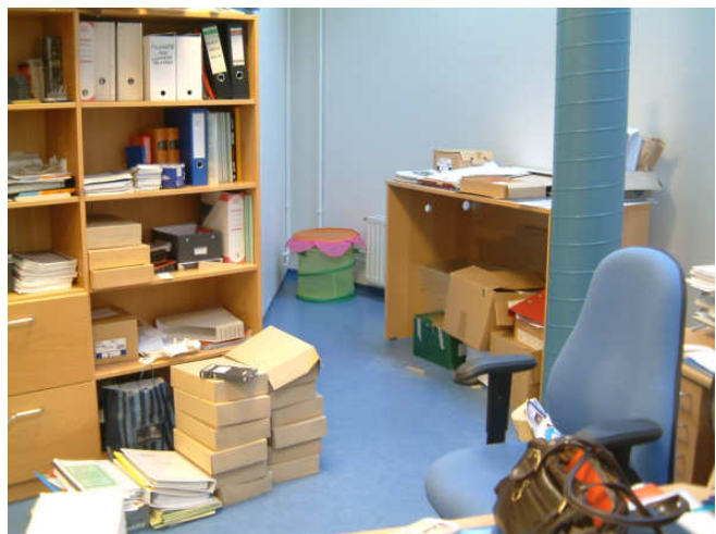
Ástandið á safninu áður en tekið var til.

Safnið hafði fallið í nokkra óhirðu eftir að hafa verið án starfsmanns í rúmlega fimm ár og tók töluverðan tíma að koma því í starfhæft horf. Mikill tími fór í tiltekt og endurskipulagningu á húsgögnum og öðrum munum safnsins. Einnig þurfti að ganga frá gögnum sem borist höfðu á þessu tímabili og hafði verið staflað á gólfu. Var þeim komið fyrir í geymslu en því miður eru þau enn ófrágengin og óskráð.