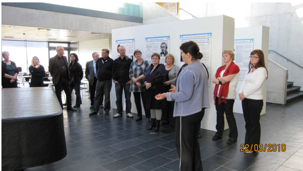
Frá ráðstefnu Þjóðskjalasafns og Héraðsskjalasafna á Höfn í Hornafirði í september 2010.