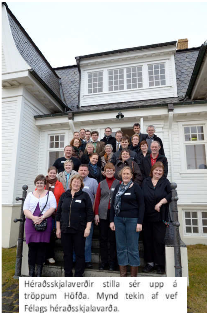
Héraðsskjalaverðir stilla sér upp á tröppum Höfða.

Á hverju hausti er haldin ráðstefna á vegum Félags héraðsskjalavarða. Markmið þessarar ráðstefnu er að þjappa saman skjalavörsluáðilum sem eru dreifðir um allt land, kynna hvað er helst á döfinni og leiðbeina.